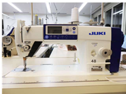
就労支援機器 (工業用ミシン)