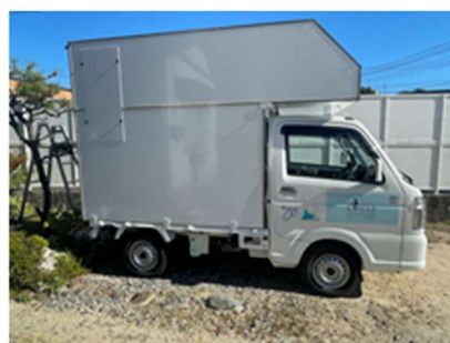
就労支援車両 (キッチンカー)