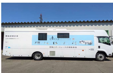
胃胸部併用X線デジタル検診車