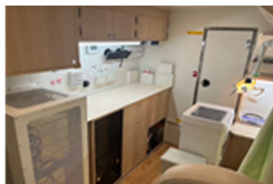
婦人科検診診察室