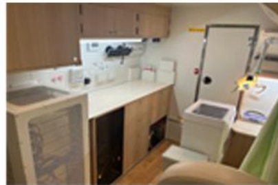
婦人科検診診察室