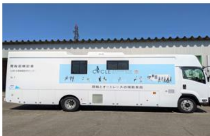
胃胸部併用X線デジタル検診車