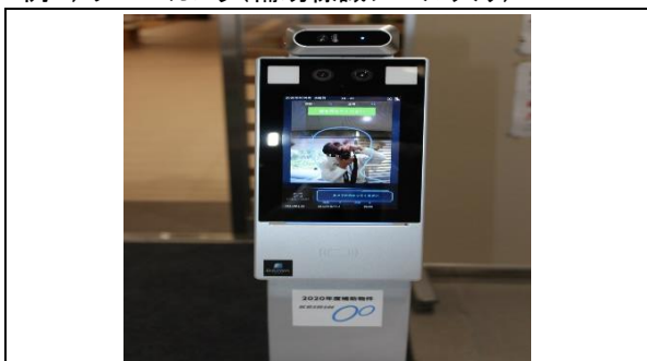
例1) サーモカメラ(補助標識シール入り)