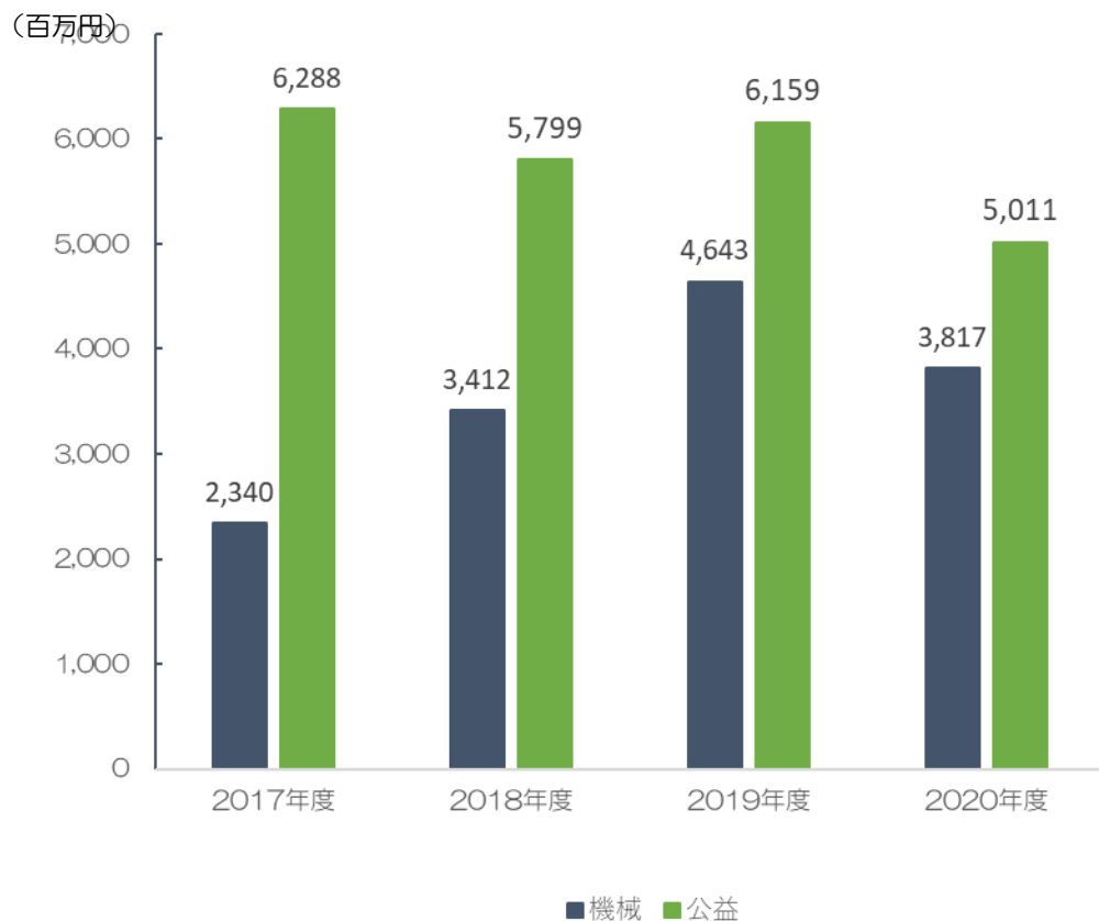
要望額の推移 (2017~2020年度)