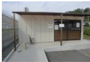
機器を設置している野菜調整室