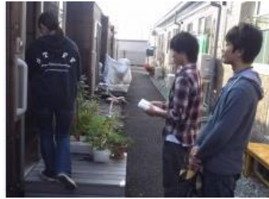
地域情報フリーペーパーの配布