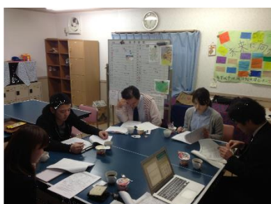
支え合いネットワークの活動

被災地域住民向けに、多賀城近隣の情報を掲載した地域情報ペーパーを作成し、仮設住宅への訪問見守り活動の中で定期的に配布。同時に自治会・住民のイベント開催支援や、自治会・世話人を対象とした「支え合いマップ作り研修」等を開催した。