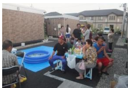
地域イベント開催支援の様子