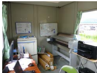
(待望の事務局コンテナ)