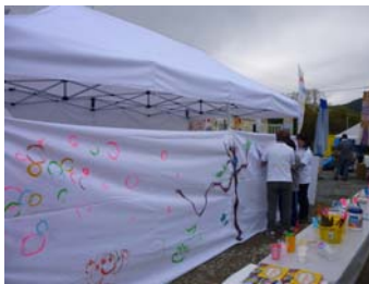
(絵等のペイント会)