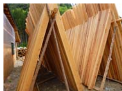
(風除けブース用板材)