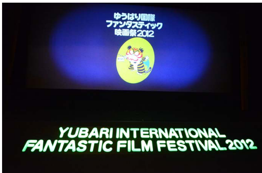
オープニング映画祭ロゴ