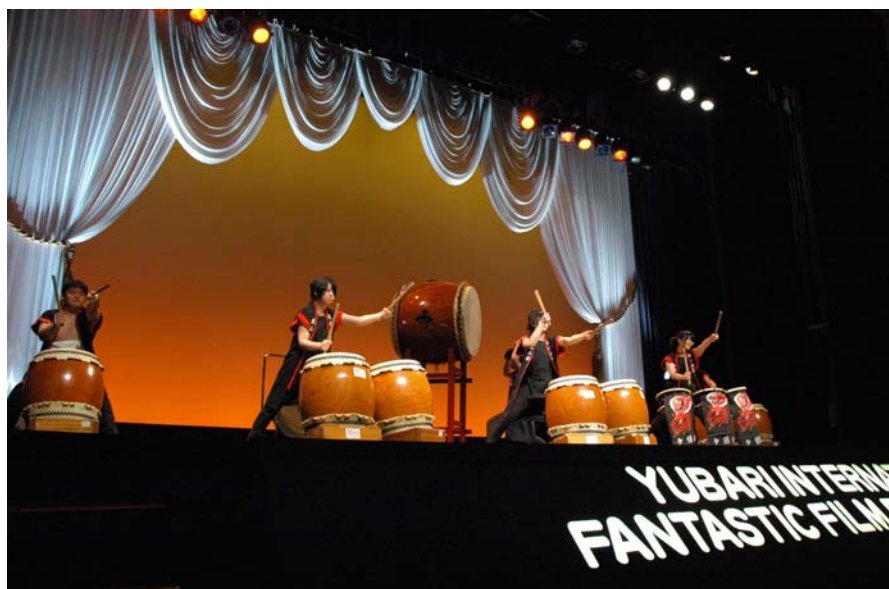
オープニングセレモニー地元幌南太鼓