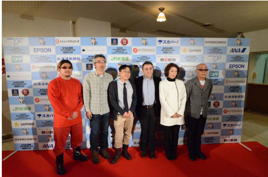
グランプリ受賞監督と審査員記者会見