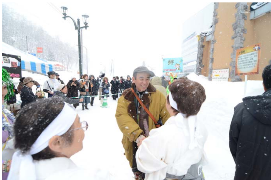
市民による歓迎セレモニー