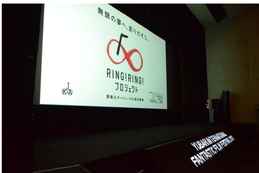
オープニングシネアド

■WEB http://yubarifanta.com/index_pc.php?ct=archive.php&langue=21010