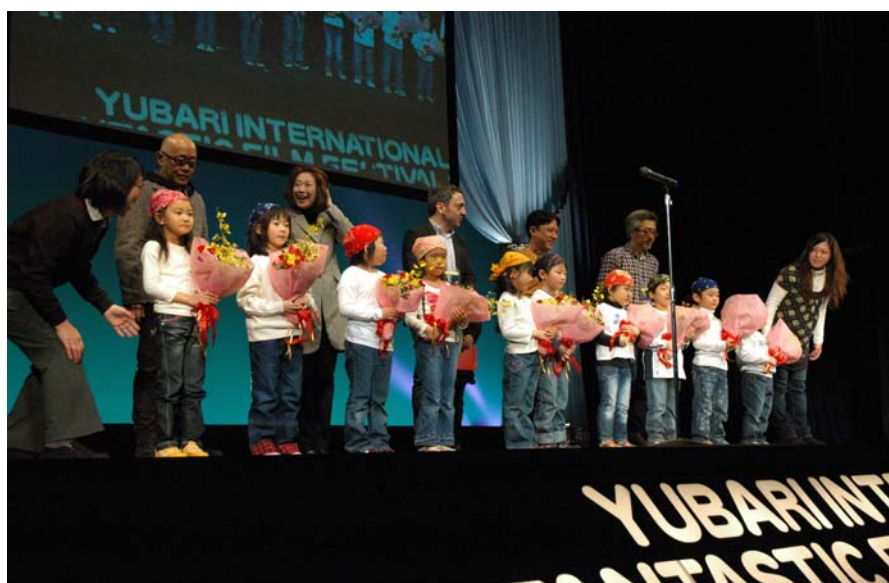
ゲスト審査員に対して地元園児花束贈呈