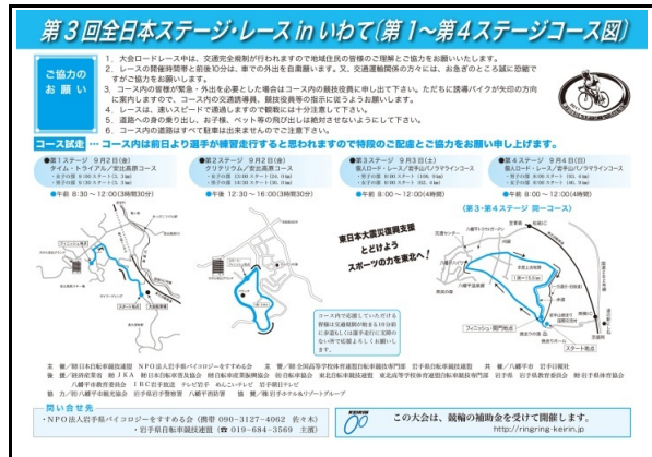
事前チラシ(交通規制)