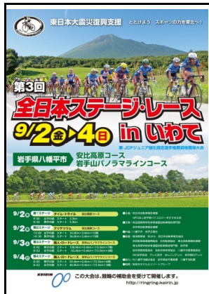
大会ポスター、プログラム