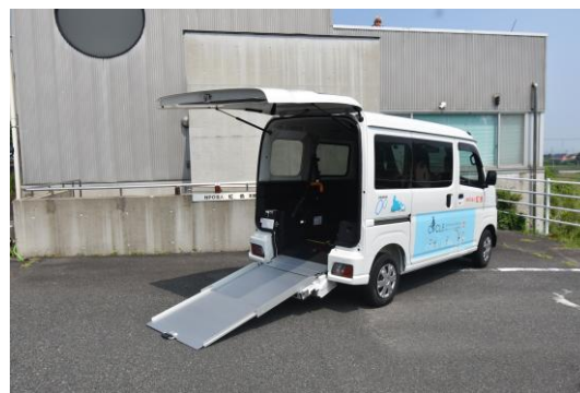
車イス移動車 4人乗り 緩やかな角度の幅広スロープを搭載