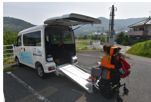
電動車イスでも頭上はゆったり