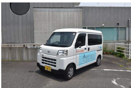
ダイハツ ハイゼット スローパー 660cc 2WD AT車