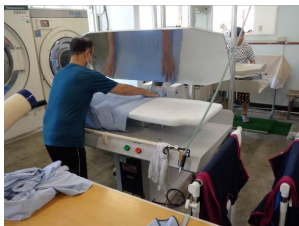
白衣胴プレス機 (型式：TAT-132S)