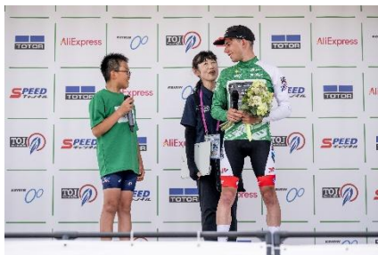
表彰プレゼンターのTOJキッズから選手へインタビュー

東京・大井ふ頭周回コース(104km)を舞台に、国内外16チームが集結。会場には大型ビジョンを設置し、協賛企業ブース、自転車教室、交通安全啓発イベント、著名人を招いたパレード走行などを展開し、来場者にエンターテインメントと教育的価値を併せて提供した。