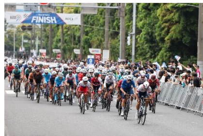
多くの観客が詰めかける東京ステージ