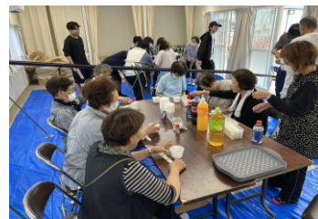
仮設住宅での交流事業