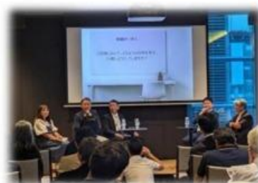
経営者団体会合時に広報を実施(中央区)