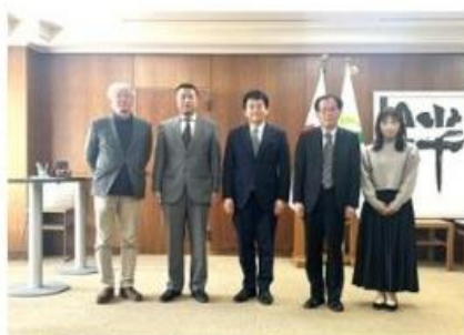
活動をさいたま市長に報告