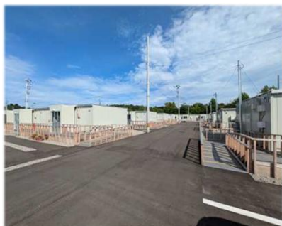
2025年9月穴水町の仮設住宅での支援