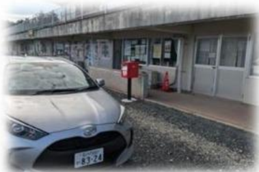
仮設住宅管理棟前にて