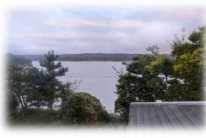
能登島の拠点にて