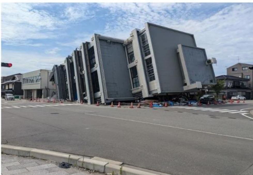
関係者より、「悲しいことですが地震被害を端的に理解してもらえる場所」と案内され撮影を行いました