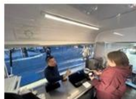
能登半島被災地支援に災害用キッチンカーを利用した復興支援の広報(さいたま市)