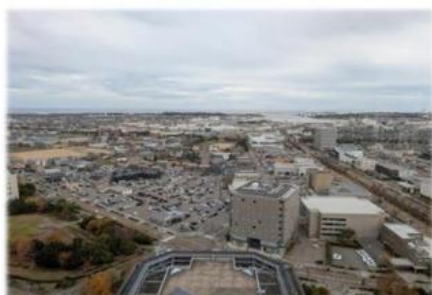
石川県庁での打合せ時能登方面を望む