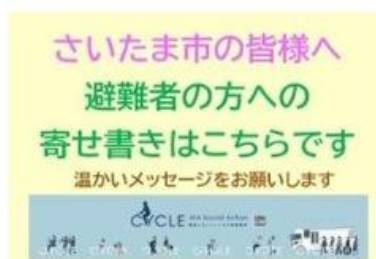
寄せ書きの紹介とさいたま市でのメッセージの募集看板