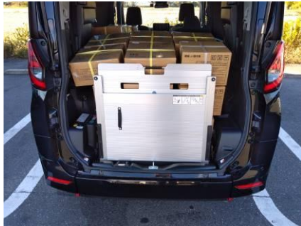
防災食自主避難所等にお届けしました