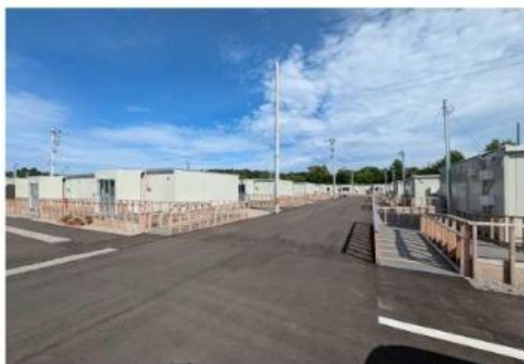
仮設住宅の支援のため管理事務所との連携は必須です。自治会が無い仮設団地も多く、居住者の撮影禁止等の注意事項があるため関係者との打ち合わせは欠かせません。