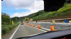
道路復旧工事の様子