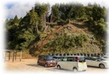
穴水町役場前の土砂崩れ