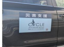
JKA標識を貼付した支援車両