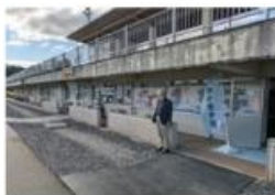
食料提供時の様子