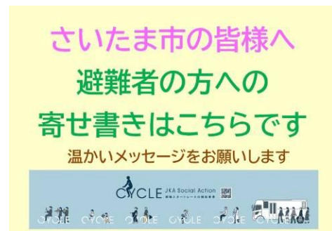
2025年12月さいたま市内での被災地情報発信