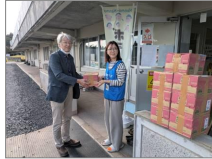
ボラセンで被災者の方に飲料を配布