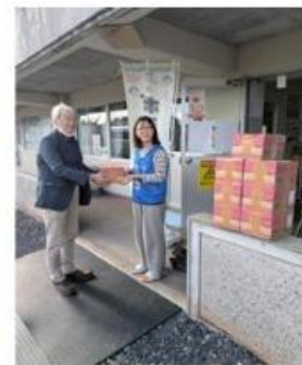
被災者用仮設住宅では精米や飲料・一部の文房具・衛生用品を配布しました