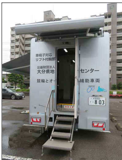
後部昇降口使用時