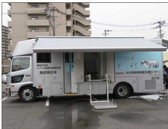
サイド大型テントとリフト使用時