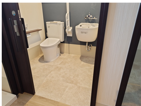
【バリアフリースイレ】