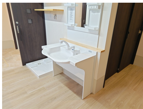
【車イスで使用できる洗面台】