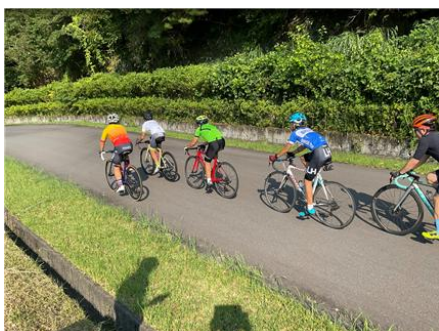
ローテーショントレーニング