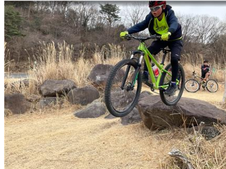
ジャンプトレーニング