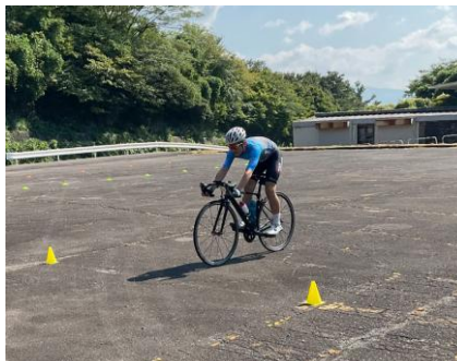
スキルトレーニング（急制動）