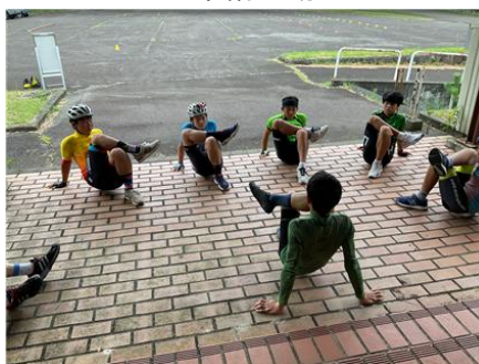
ストレッチ・準備運動