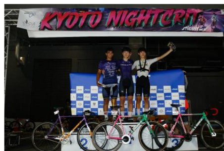
補助事業の表記があるトラスと表彰式