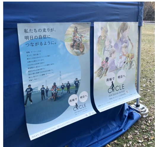
会場に設置した補助事業の掲示物