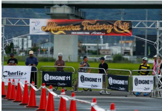
補助事業の表記があるトラス

参加者は工場内を駆け抜ける斬新なコースレイアウトを楽しんで貰う事が出来た。 天候が不安定だったが、キッズレースでは地元の小学生が多く参加。普段体感することの 出来ないコースで楽しい経験が出来たと伺うことが出来た。レース後には「SPINROOM」を 行ない、レースに参加した事のない方々が疑似体験を楽しんでいる様子もうかがえた。