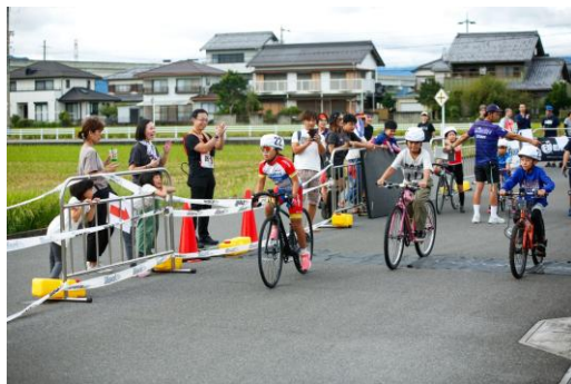
多くの参加を頂いたキッズレース