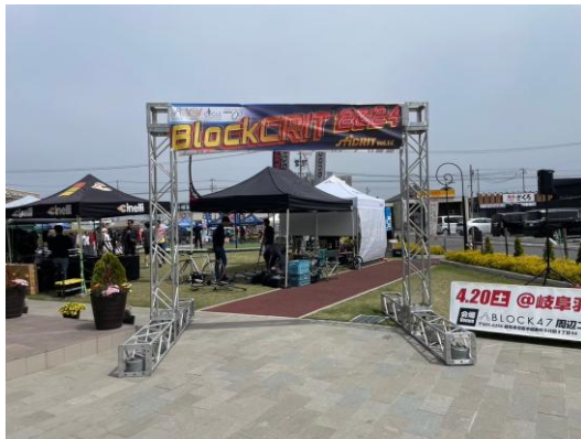
補助事業の表記があるトラス

岐阜羽島駅前近郊道路と隣接する商業施設を会場とし、遠方の地域から参加する選手が多く、更に韓国からの選手もレースへ参加。レースのみならず、キッズレース体験には羽島警察署の方々に自転車安全講習を実施。自転車の楽しさを体感してもらう事が出来た。レース後には自転車とローラー台を用いたゲーム「SPINROOM」でレースの疑似体験をしてもらう事も出来た。