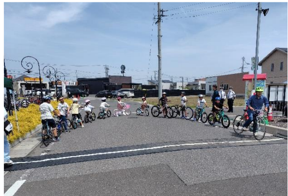
子供たちに向けて自転車安全講習を実施している様子