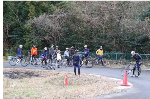
コースの中で実践を交えての講習