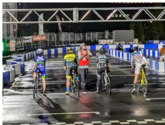
レース再開後に行われた女子決勝

③ 2024 KYOTO NIGHT CRIT 開催日 8月3日(土) 参加者 108名 観覧者 約300名 京都サンガスタジアムとその周辺道路を会場として行われた。