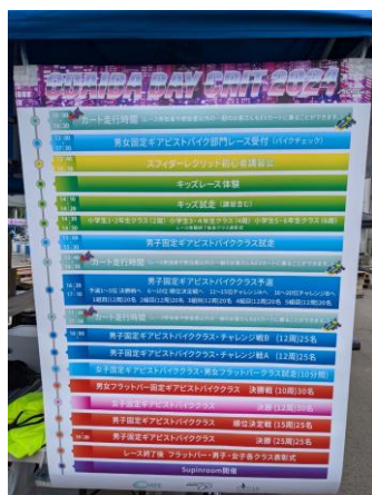
補助事業の表記をしたタイムスケジュール

② 2024 ODAIBA BAY CRIT 開催日 7月6日(土) 参加者 122名 観覧者 約800名 会場はCITY CIRCUIT TOKYO BAYのカートコース内。時期として熱中症等を懸念し対策しておりましたが、レースシーンに入ってから過去にない豪雨と雷により一時中断。安全を最優先に考えゆりのあるスケジュール構成を行なう事により、レース再開後に柔軟な予定変更で一通りのレースを実施する事が出来た。一時中断前にキッズレース、初心者講習も完了、一時中断時には「SPINROOM」を開催。カートコースでの貴重なレース体験をしてもらう事が出来た。