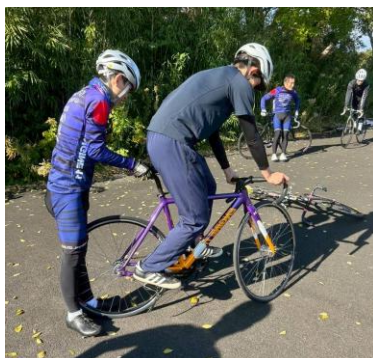
レンタルバイクを使用しての講習

講習会ではピストバイクを安全で気軽に楽しく乗ってもらう為に、初心者への安全講習、レンタルバイクの貸し出し、模擬レース等、参加される方に寄り添った講習、練習を行っている。参加される年齢層も広く未就学児から高齢層までの参加があり、年齢層によって講習の内容を分ける等、常に工夫を凝らし、観覧者にも楽しさを見出してもらう様務めている。