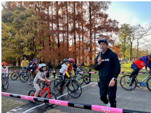
キッズ講習会・レース体験の様子

会場は埼玉県さいたま市 秋ヶ瀬公園で行なわれた「秋ヶ瀬の森バイクロア」の会場を使用し行なわれた。キッズ講習会、レース体験会は多くの参加者で賑わいを見せた。海外からの参加者も見受けられた。レースに参加するだけでなく、幅広い年齢層の観覧者に自転車の楽しさを肌で感じてもらい、ピストバイク・競輪に対する理解や認知度の向上に取り組むことが出来た。