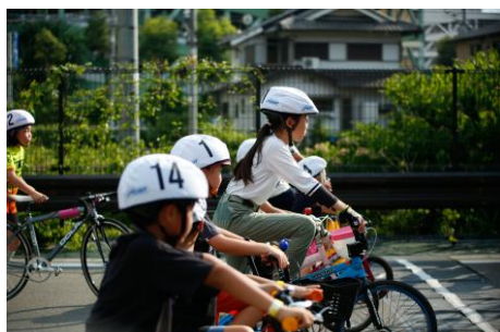
キッズレースの様子