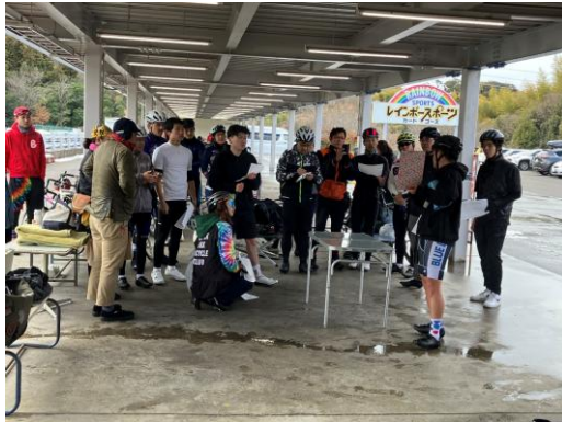
講師を招いての講習