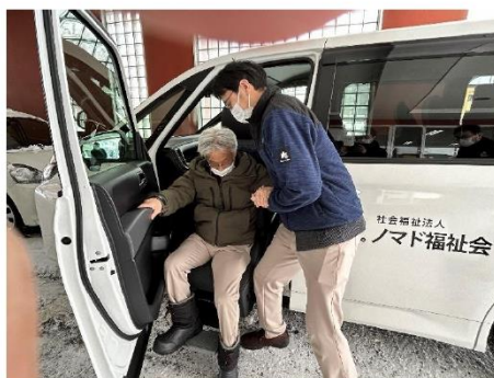
助手席が下がるので楽に降りられます