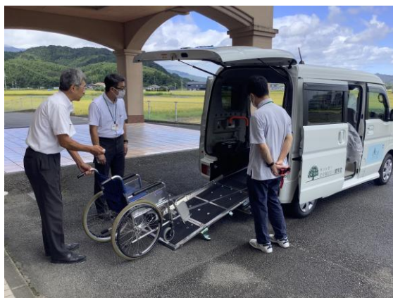
【特殊装備の特徴が分かる写真】