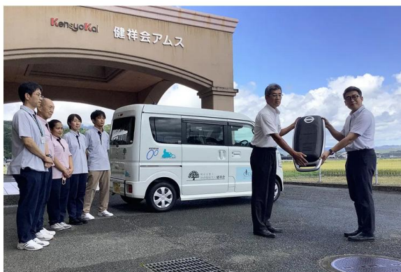
納車セレモニー(日産サッチョ 様)

「公益財団法人JKA2023年度補助事業 競輪公益資金として」 助成額：1,125,000円 日産クリッパーリオ（軽自動車）スロープ仕様