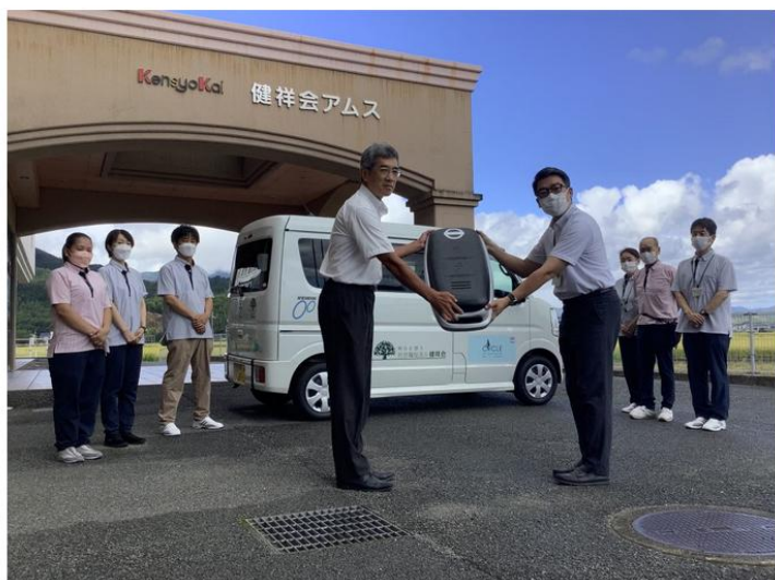
納車セレモニーを行いました。