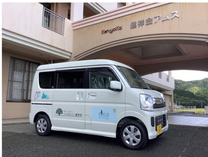
日産 CLIPPER RIO 車いす（スロープ式）仕様です。