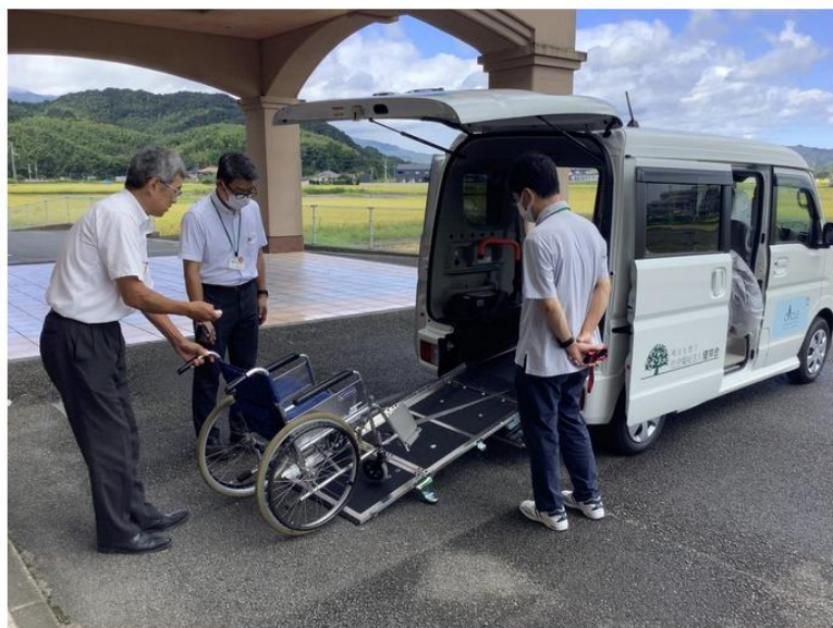
操作方法を教わります。