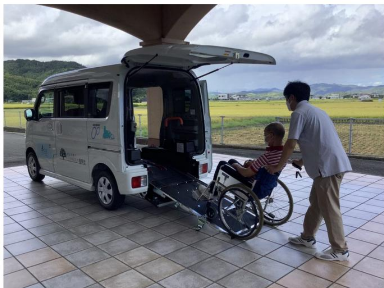
実際に操作してみます。