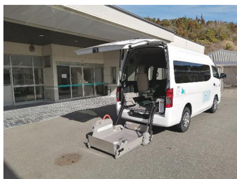
乗降用リフト装置