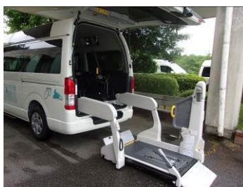
リフト付きで車椅子を 2台分乗車できます