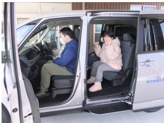
納車後、利用者様が初めて車両に乗り込む様子