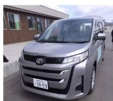
社会福祉法人 能代よくし会 理事長 三澤 弘文