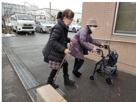
通院へのお出迎え