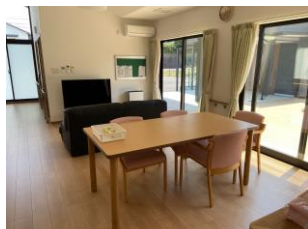
中は明るい基調に