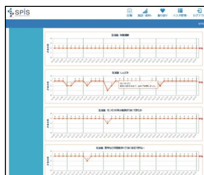
クラウド日報システム 画面サンプル (左：日報入力画面 右：統計グラフ画面)