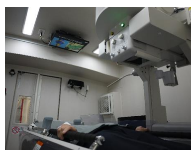
胃透視台上部 多言語支援システム