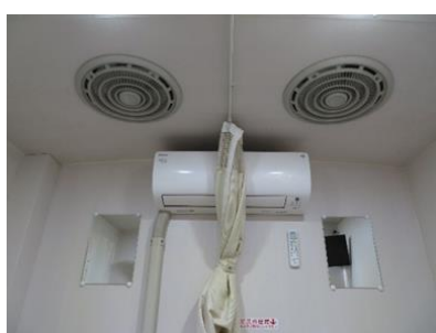
更衣室上部換気扇（個別）