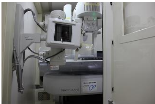
胸部X線管球及び胃部撮影装置側面①