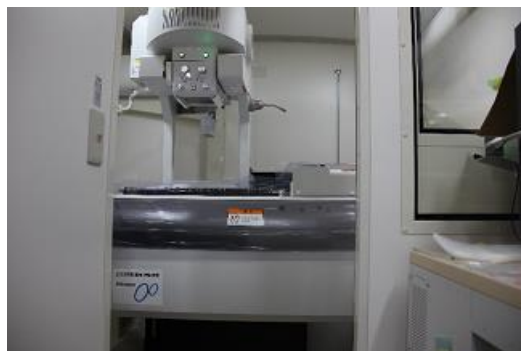
胃部撮影装置側面②