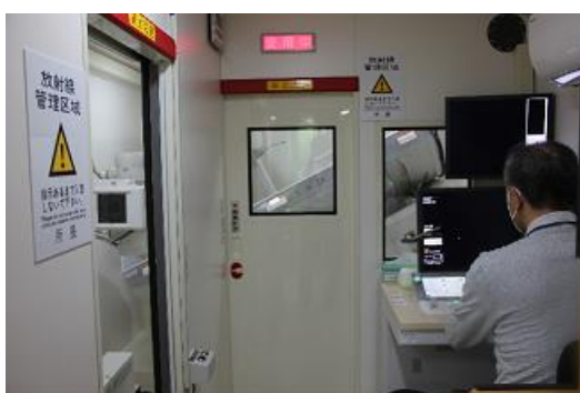
胃部X線検査の様子（後面）