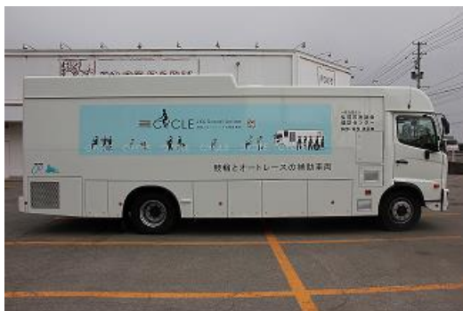
胃部・胸部検診車側面の外観