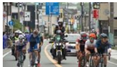
レース状況 (市街地)