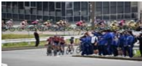
コース沿道応援風景