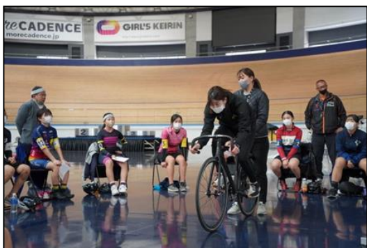
トレーニング風景