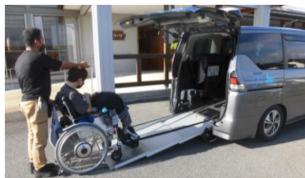
② 車いすスロープ使用