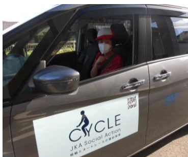
③ 飛沫防止シート使用