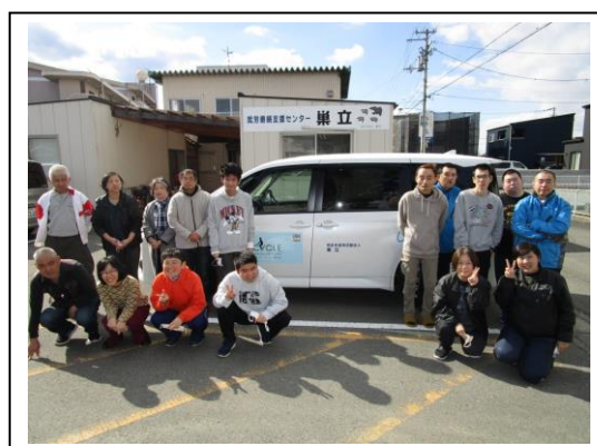
送迎車の前で全員集合