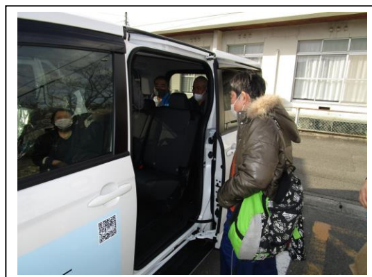
利用者さん 送迎車へ乗車中②