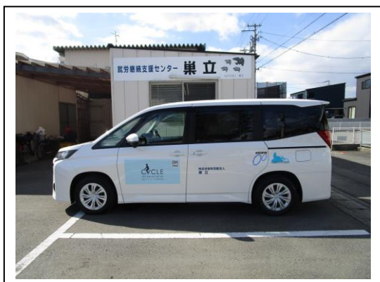
車両側面（助手席側）

http://nposudachi.com/補助金事業/公益財団法人jka補助金事業/