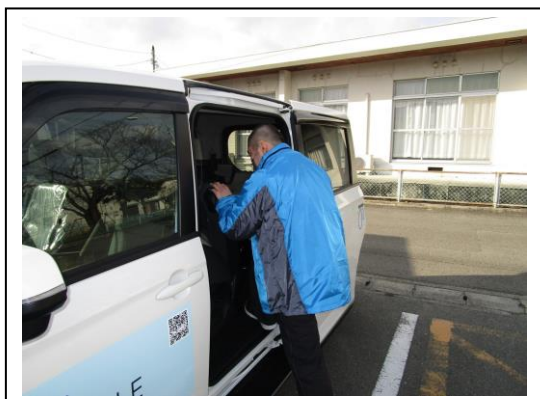
利用者さん 送迎車へ乗車中①