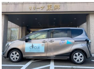
トヨタシエンタハイブリッド

移送車4 [特別装備なし] https://monjuen.com/publics/index/163/