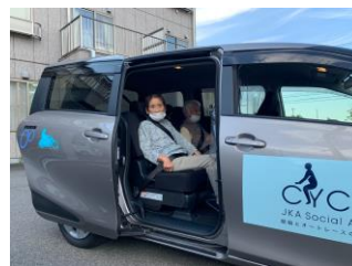
安全に乗降できます