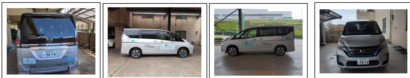
車いすスロープ式