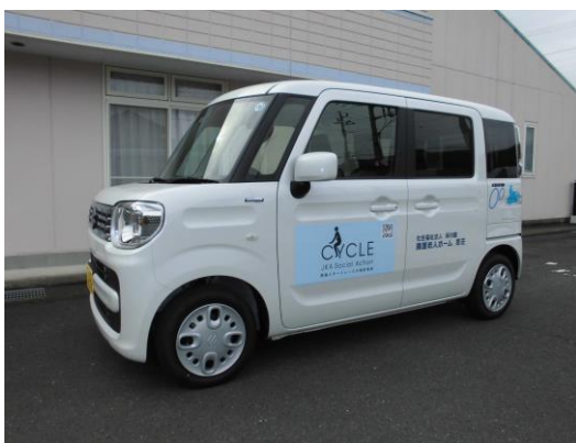
両側・後部に補助標識、見やすく表示