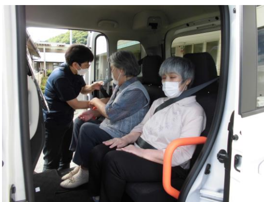
後部座席に乗車、乗降がスムーズ