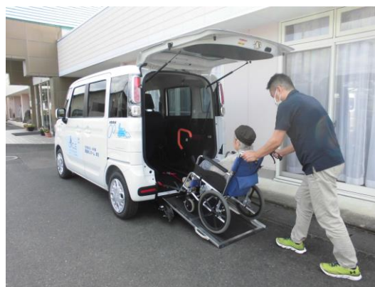
車いすによる乗車、介助者の負担が軽減