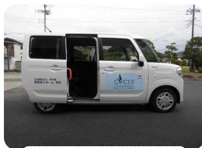
両側スライドドアで開口部が広く乗り降りが楽です。