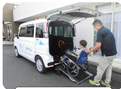
一体型スロープで出し入れが簡単、乗り降りもスムーズです。