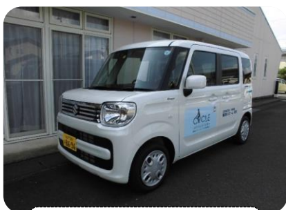
小回りが効くので、狭い道路でも安心です。

公益財団法人 JKA 様はじめ、ご協力を賜りました関係者の皆様に感謝申し上げます。