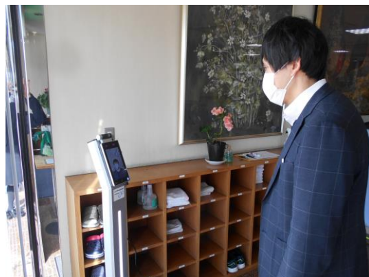
特別養護老人ホーム玖珂苑・老人保健施設くが 正面玄関