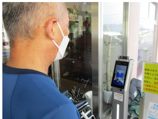
有料老人ホームせんぞく苑 正面玄関