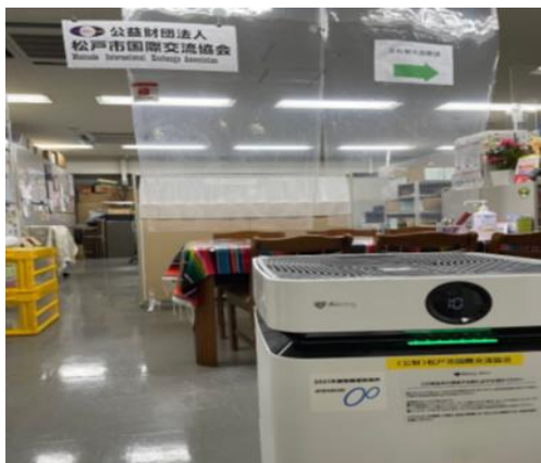
松戸市国際交流協会 事務所

当協会事務所並びに国際友好ルームに空気清浄機を合計3台導入することにより、室内の換気を補助し新型コロナウイルス感染予防に努める。また、国際友好ルームにおいてはサーモカメラ1台を入りに設置し、体調不良者の来場を未然に防ぎ新型コロナウイルス感染症の拡大防止並びにクラスターの発生を防ぐ。