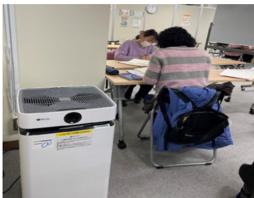
国際友好ルーム日本語教室