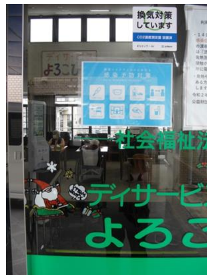
換気対策のステッカー貼付