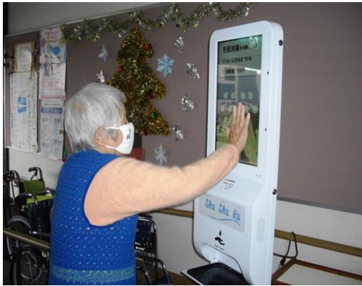
使用状況（検温中の利用者）