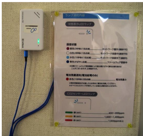
CO2 濃度測定器全体の写真