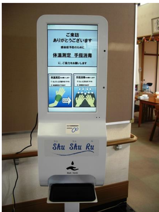
検温器+消毒ディスペンサー（非接触型）全体の写真