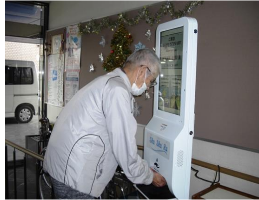
使用状況（手指消毒中の利用者）