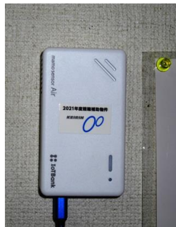
補助標識シールの貼付