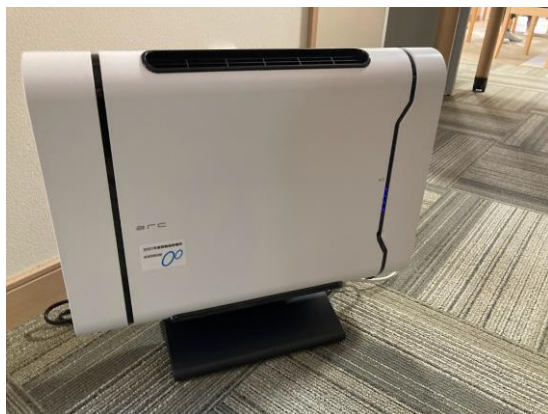
光触媒除菌脱臭機 (大型)

( http://www.zc.ztv.ne.jp/ikiikiomi/jkahojokin.html )