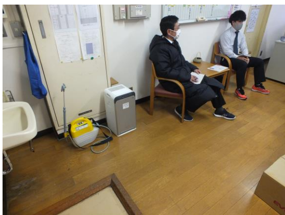
事務所内で毎日稼働、1日中ついている