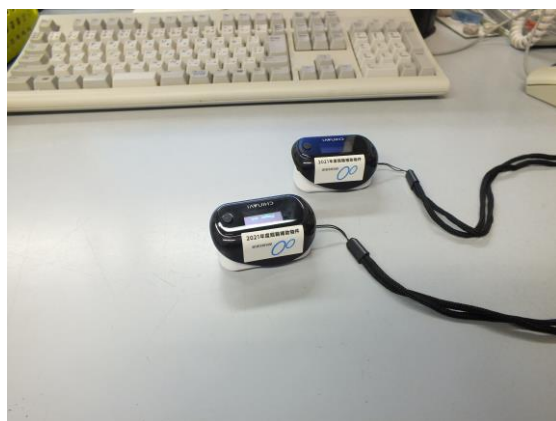
パルスオキシメーター事務所内に設置