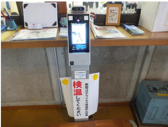
受付にサーモカメラ設置

http://www13.plala.or.jp/yui625808/kohou.pdf