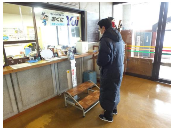
町民総合体育館受付での素早い検温