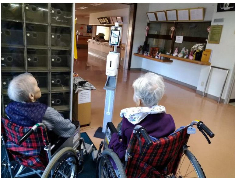
サーモカメラを施設玄関出入口に設置