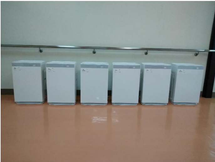
加湿機能付き空気清浄機 6 台整備