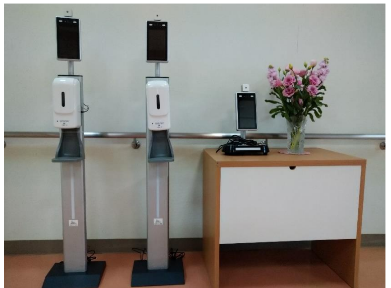
サーモカメラ（非接触型体表面温度モニタリング装置）3 台設置