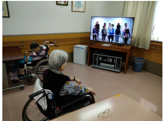
空気清浄機を高齢者施設内各ホールに設置