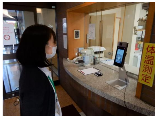
顔認証型サーマルカメラの使用風景