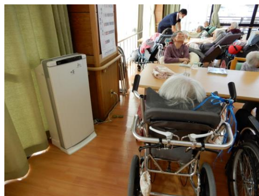
特養ホールで作動中の空気清浄機