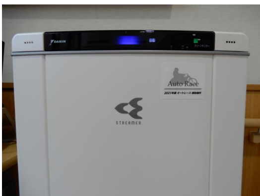
空気清浄機に添付された標識シール