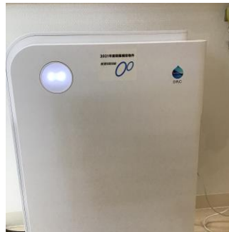
空気清浄機 アップ