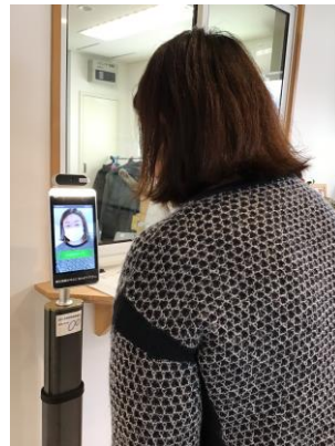
非接触型サーモグラフィー使用の様子

○空気清浄機は、高性能な医療型を購入し、今まで不足であった廊下の空気清浄を行うことができるようになりました。