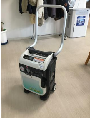
発電機 使用の様子

○発電機があることで、災害時には、施設を利用者の避難場所として活用できるようになりました。