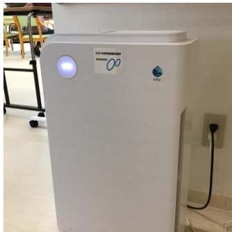
空気清浄機 使用中

○空気清浄機は、高性能な医療型を購入し、今まで不足であった廊下の空気清浄を行うことができるようになりました。