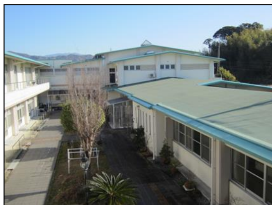
補修後の東側屋根