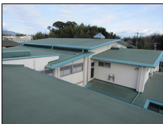
補修後の北側屋根