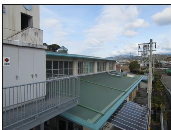
補修後の西側屋根