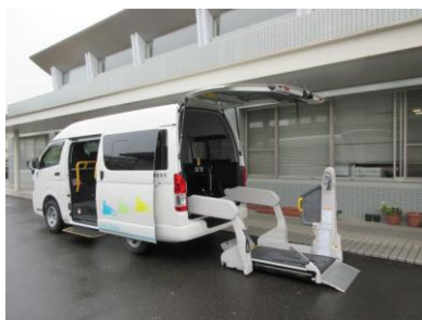
リフト付き送迎車輛