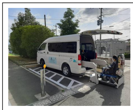
車いす利用者が、帰宅時に、リフトを使用して地面に下りた場面