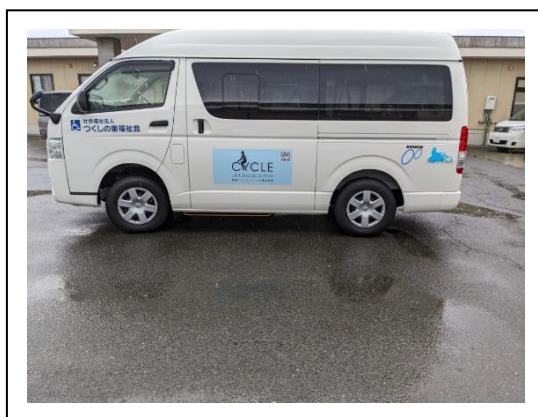
スマートな外観の福祉車両

https://t-tukusi.or.jp/blog/information/ (2022年11月18日付)