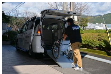
特別装備仕様風景