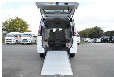
特別装備 (スロープ式)