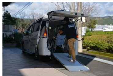
使用している風景