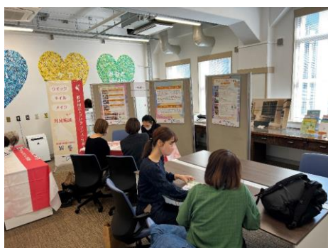
イベントでのアピアランス・サポート相談

行政や医療者との連携により、がん患者さんが気軽に外見変化について相談できる場（病院や行政の施設だけでなく美容室、関連イベントなど）をつくり、専門知識を持つ美容専門家が脱毛や爪肌の変色など外見に関する悩みにアドバイス・支援を行うことで患者さんの苦痛を軽減する。