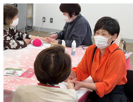
副作用軽減のためのネイルのケア体験