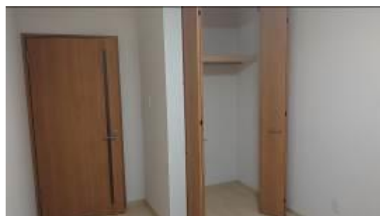
居室クローゼット